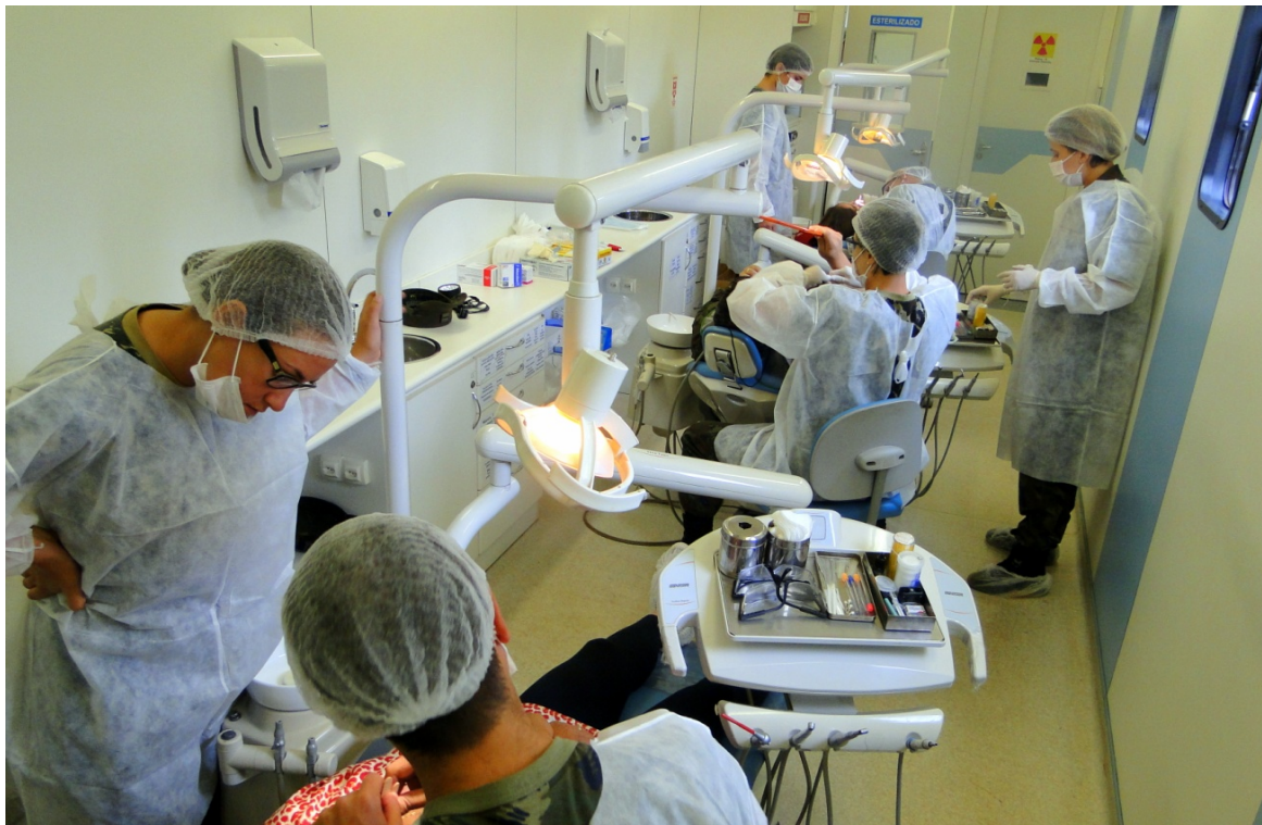
Figura 2: Vista interna da UMO.