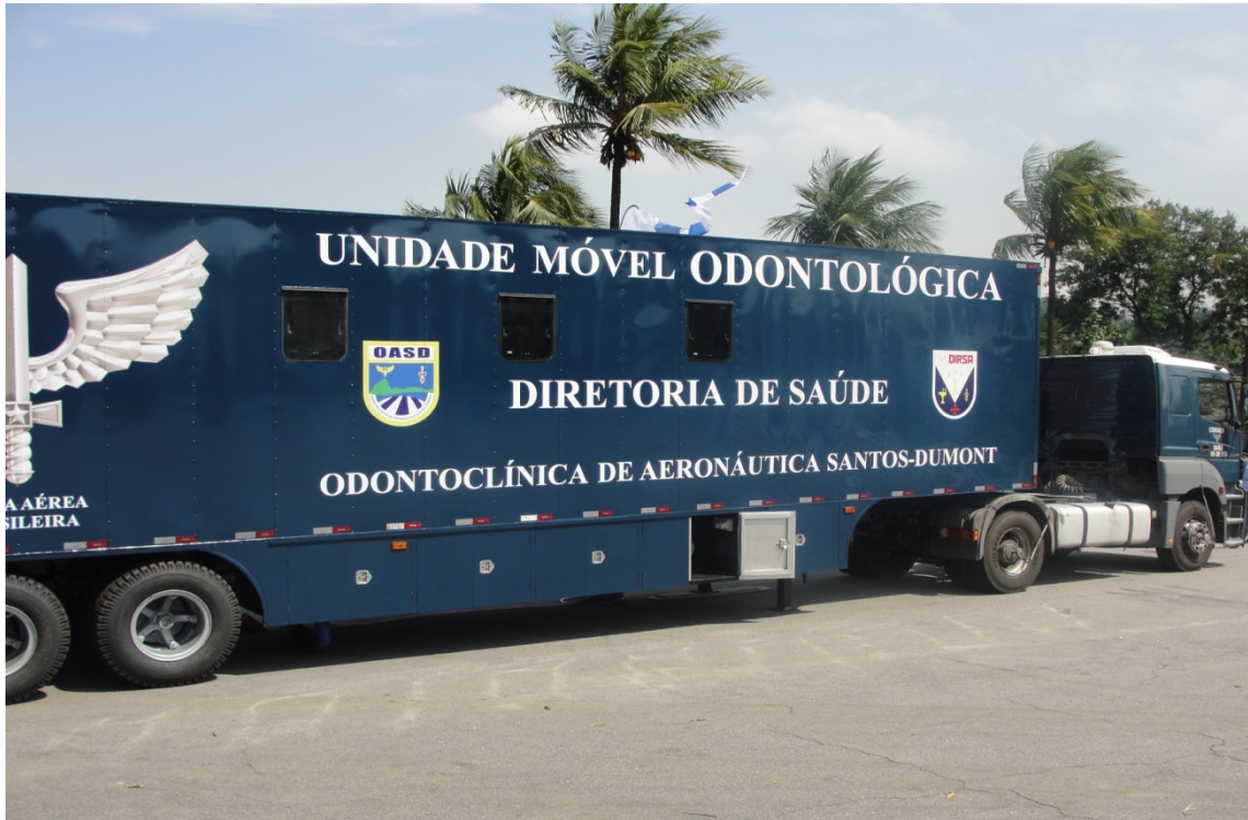
Figura 1: Vista externa da UMO.