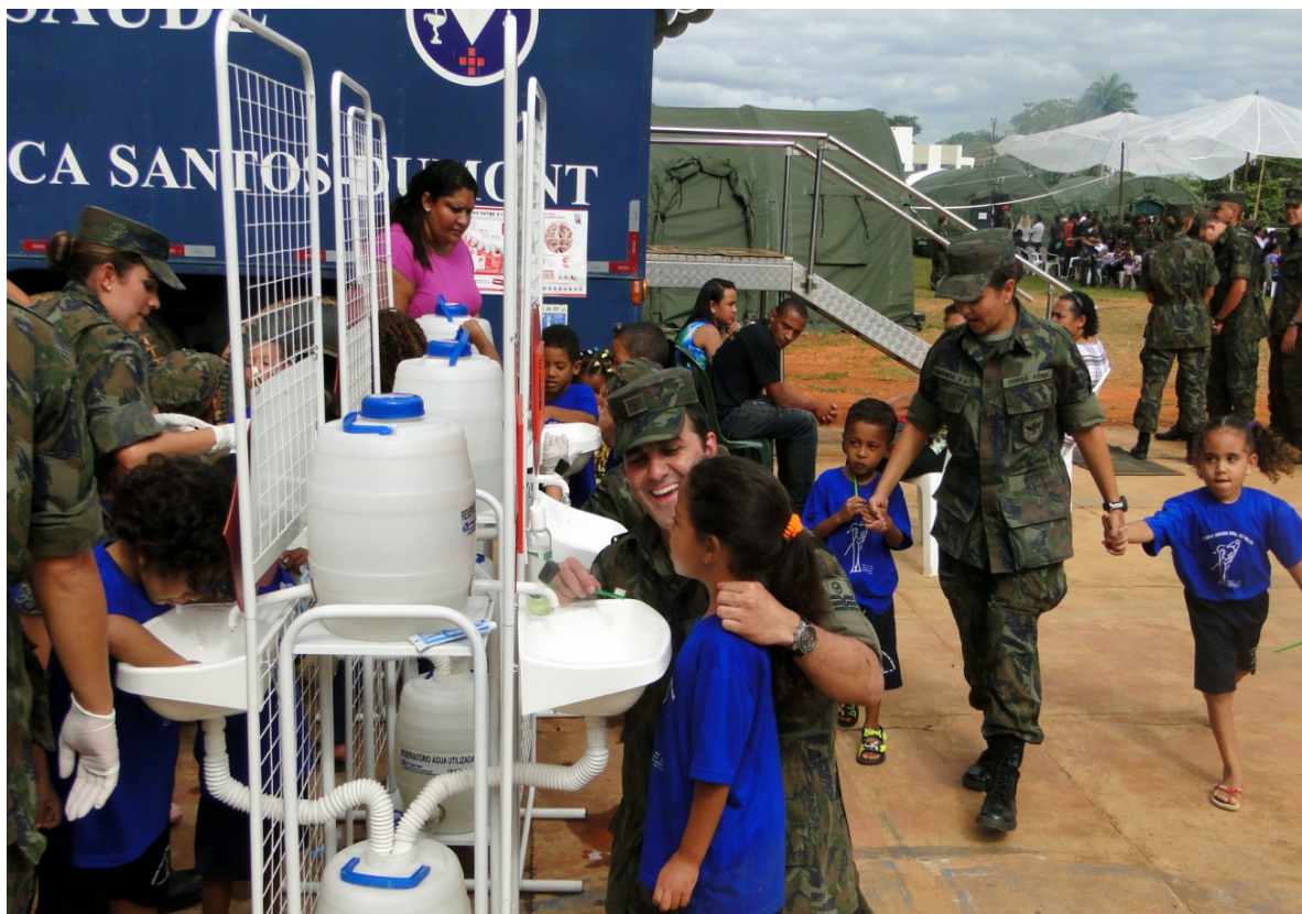
Figura 4: Escovódromo em utilização.