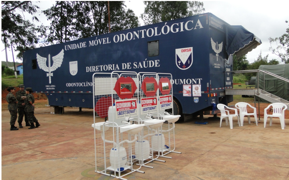
Figura 3: Escovódromo.