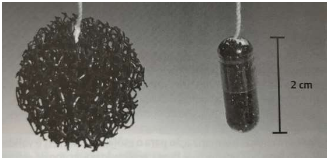
Figura 4 – Cytosponge

Fonte: Tratado de Endoscopia Digestiva, 2018