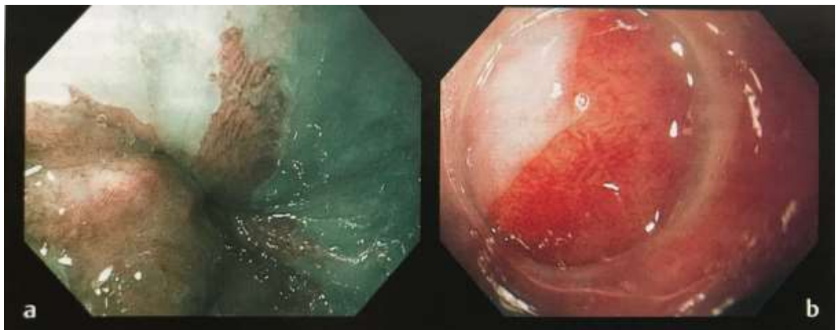
Figura 2 – EB após cromoscopia digital e magnificação de imagem.

(a) Epitélio colunar em esôfago distal vista com endoscópio de alta resolução e Narrow Band Imaging (NBI). (b) Mesma área em magnificação de 75 vezes, evidenciando aspecto viloso.