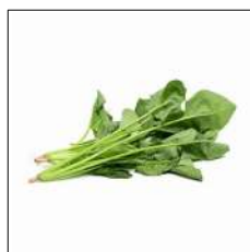
Fig 18 – Variedade de espinafre.