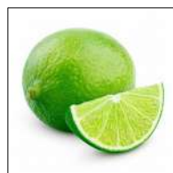
Fig 53 – Limão Tahiti.