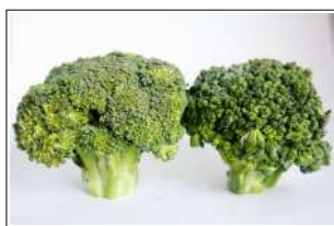
Fig 13 – Variedades de brócolis.