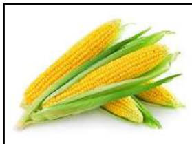
Fig 29 – Variedade de milho verde.