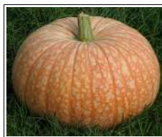
Fig 30 – Variedade de moranga.