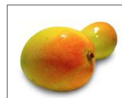
Fig 64 – Manga rosa.