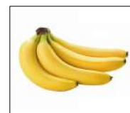
Fig 41 – Banana nanica.