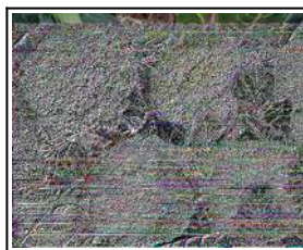
Fig 17 – Variedades de couve-flor.