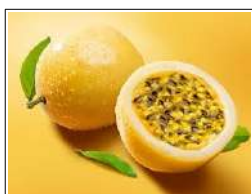
Fig 65 – Maracujá amarelo.