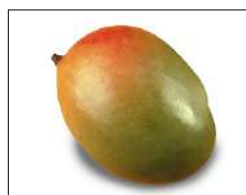
Fig 63 – Manga Tommy.