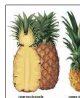
Fig 38 – Abacaxi Cayena.