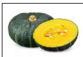
Fig 23 – Variedade de abóbora.