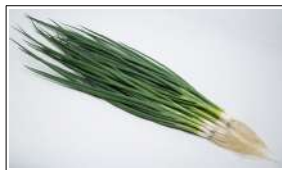
Fig 14 – Variedade de cebolinha.