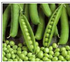
Fig 27 – Variedade de ervilha.