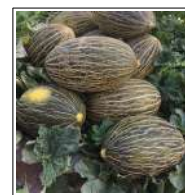
Fig 73 – Melão pele de sapo.