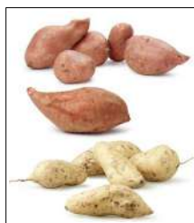
Fig 3 – Variedades de batata-doce.