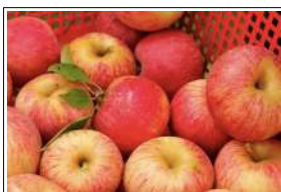
Fig 56 – Maçã Gala.