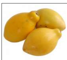
Fig 66 – Maracujá doce.