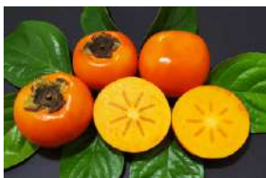
Fig 43 – Caqui Fuyu.