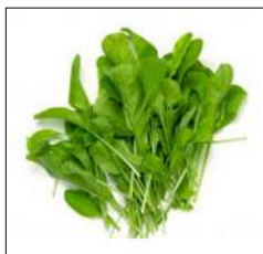
Fig 21 – Variedade de rúcula.