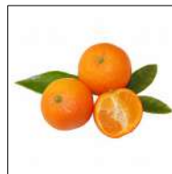
Fig 54 – Limão cravo.