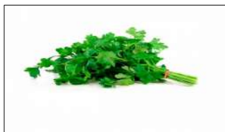
Fig 15 – Variedade de coentro.