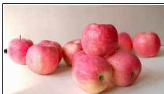
Fig 57 – Maçã Fuji.