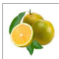
Fig 50 – Laranja pera.