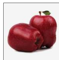
Fig 58 – Maçã Red ou Argentina.