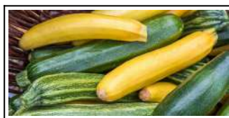
Fig 24 – Variedades de abobrinha.