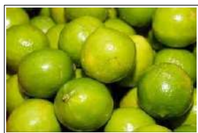
Fig 52 – Limão galego.