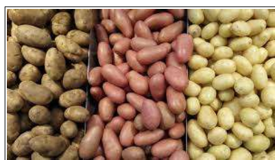
Fig 2 – Variedades de batata-inglesa.