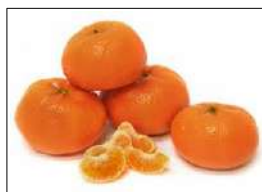
Fig 77 – Tangerina morgote