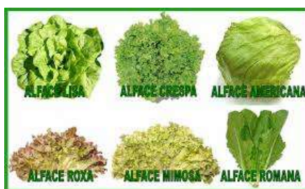
Fig 12 – Variedades de alface