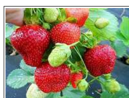
Fig 75 – Morango bourbon.