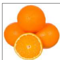
Fig 49 – Laranja Bahia.