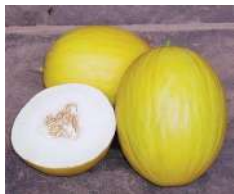
Fig 71 – Melão amarelo.