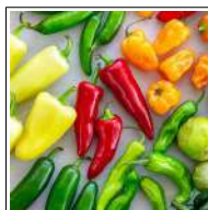
Fig 32 – Variedades de pimenta.