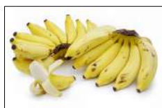
Fig 40 – Banana-maçã.