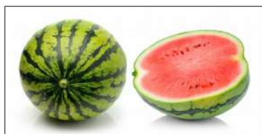
Fig 69 – Melancia vermelha.