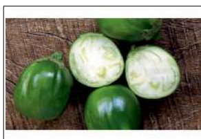
Fig 28 – Variedade de jiló.