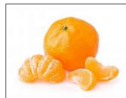
Fig 78 – Tangerina mexerica.