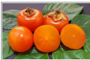
Fig 44 – Caqui Rama forte.