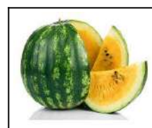
Fig 70 – Melancia amarela.