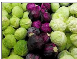
Fig 20 – Variedades de repolho.