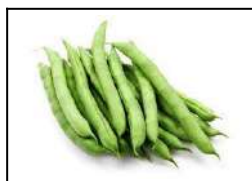
Fig 36 – Variedades de vagem.