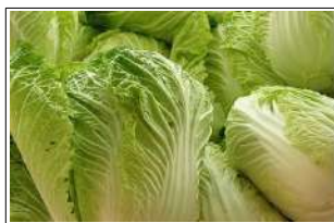
Fig 10 – Variedade de acelga.