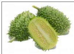
Fig 28 – Variedade de maxixe.