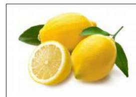
Fig 55 – Limão siciliano.