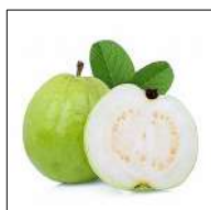
Fig 47 – Goiaba branca.