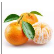
Fig 76 – Tangerina Ponkan.