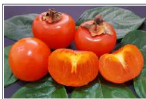
Fig 45 – Caqui Taubaté.