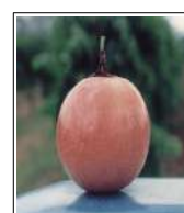
Fig 68 – Maracujá maçã.