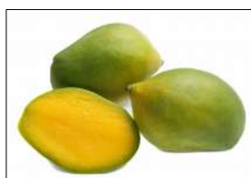
Fig 61 – Manga espada..