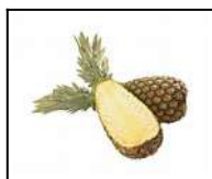
Fig 37 – Abacaxi pérola.