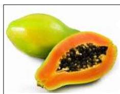
Fig 59 – Mamão papaya.