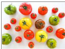
Fig 35 – Variedades de tomate.