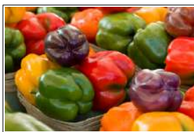
Fig 33 – Variedades de pimentão.