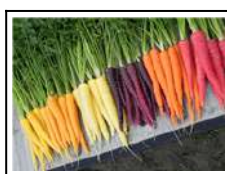
Fig 6 – Variedades de cenoura.