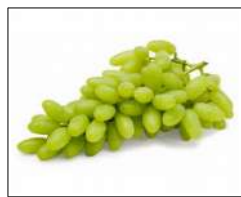
Fig 81 – Uva Thompson.