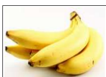
Fig 39 – Banana prata.