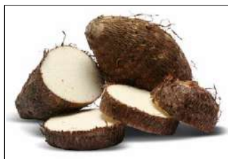
Fig 7 – Variedade de inhame.