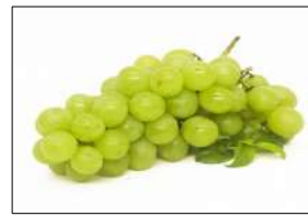
Fig 83 – Uva Itália.