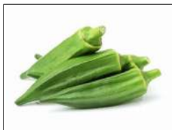
Fig 34 – Variedade de quiabo.