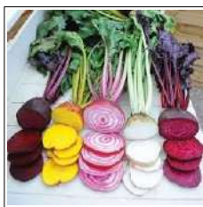
Fig 4 – Variedades de beterraba.