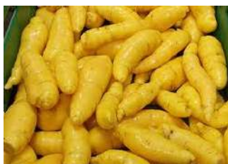
Fig 9 – Variedade de mandioquinha.