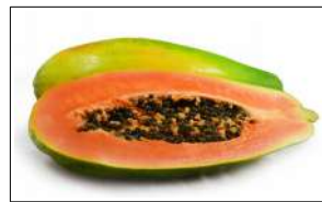
Fig 60 – Mamão formosa.