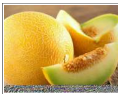
Fig 72 – Melão gália.