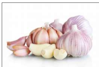
Fig 1 – Variedade de alho.