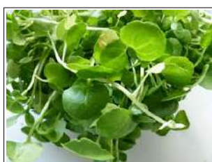
Fig 11 – Variedade de agrião.