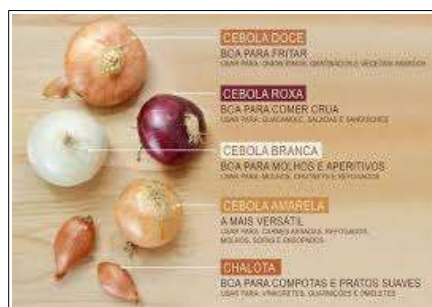
Fig 5 – Variedades de cebolas e seu uso culinário.