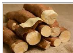
Fig 8 – Variedade de mandioca.