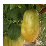
Fig 67 – Maracujá Açú.