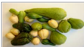
Fig 26 – Variedades de chuchu.