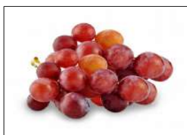
Fig 80 – Uva rubi.