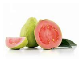
Fig 48 – Goiaba vermelha.