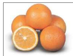
Fig 51 – Laranja seleta.