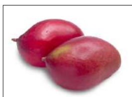
Fig 62 – Manga Palmer.