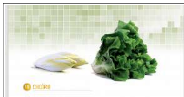
Fig 19 – Variedades de chicória: endívia e escarola.