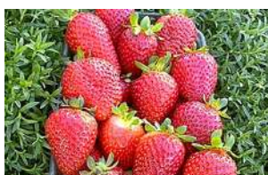
Fig 74 – Morango albion.