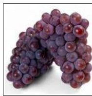
Fig 82 – Uva Niágara.