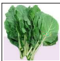
Fig 16 – Variedade de couve manteiga.