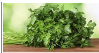
Fig 22 – Variedade de salsa.