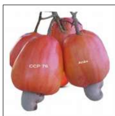
Fig 42 – Caju CCP 76 e Caju Anão.