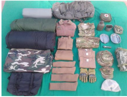
Equipo individual que fica com o homem.