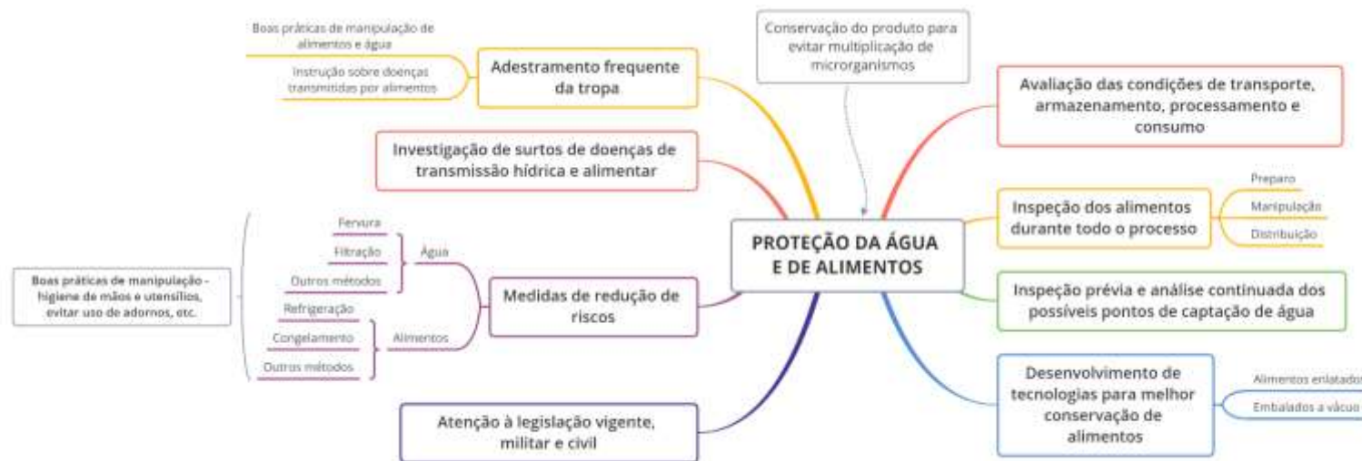
Figura 5. Principais tarefas e atividades a serem desenvolvidas no contexto de proteção da água e dos alimentos, segundo painel de especialistas.