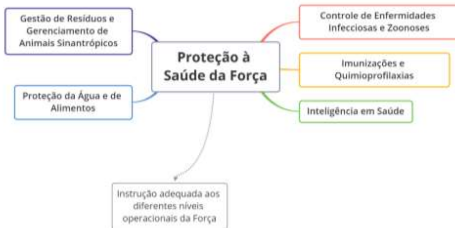
Figura 1: Principais eixos da proteção à saúde da Força.

Os eixos definidos como chave na Proteção à Saúde da Força estão elencados na Figura 1. A seguir, são descritas as principais tarefas para abordagem de cada um destes eixos.