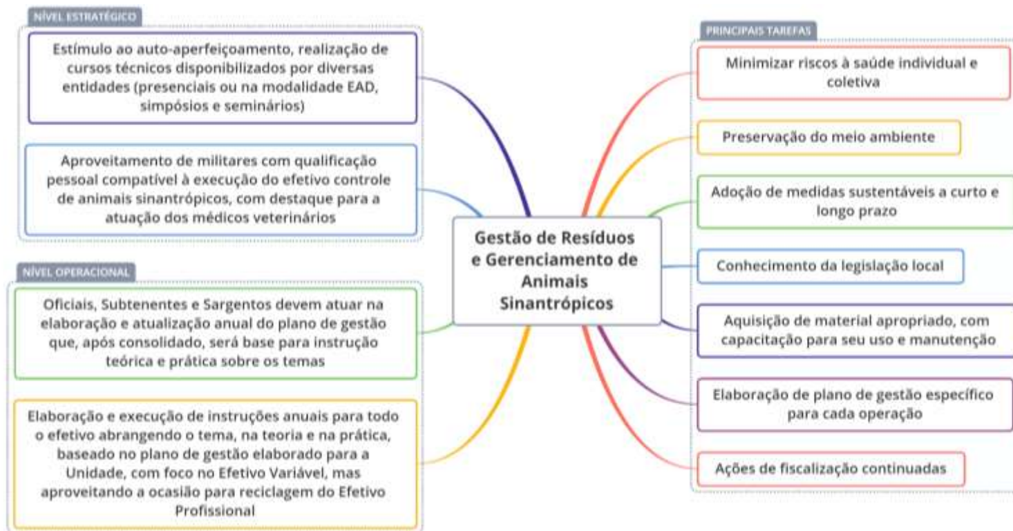
Figura 3. Principais tarefas e atividades, em nível operacional e estratégico, a serem desenvolvidas para o gerenciamento de resíduos e controle de animais sinantrópicos, segundo painel de especialistas.