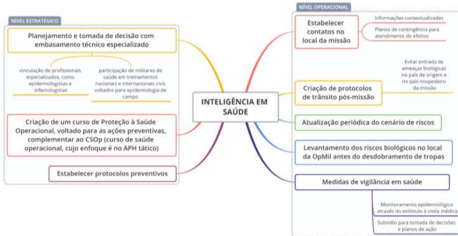
Figura 6. Principais tarefas a serem desenvolvidas, em nível operacional e estratégico, no âmbito da inteligência em saúde, segundo painel de peritos.