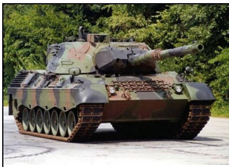
Imagem 1 - Carro de Combate Leopard 1 A5 BR

O contrato inicial abrangia serviços de manutenção preventiva e corretiva, assegurando um fluxo contínuo de peças de reposição até o ano de 2027. Entre 2010 e 2012, mais dois lotes de Leopard 1A5 foram recebidos, elevando o total para 220 veículos operacionais. Esses blindados substituíram modelos mais antigos, como o Leopard 1A1 e o M-60 Patton, aprimorando significativamente a capacidade operacional do Exército Brasileiro (Armas Nacionais, 2023; Tecnodefesa, 2023).