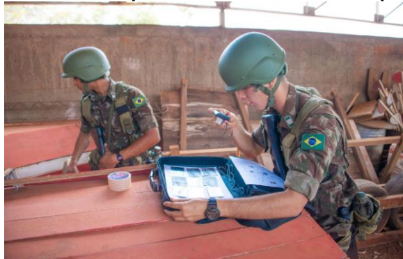
Figura 4- Coleta e reporte de dados durante as operações

É necessário um esforço de todos os Comandantes de Frações, nos diversos escalões, para que esta atividade seja potencializada e realizada de forma oportuna e eficaz. Para isso é vital que a coleta e o reporte dos dados sejam treinados e realizados durante a condução das operações.