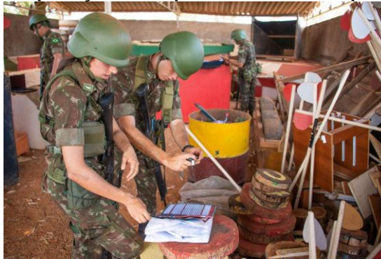
Figura 2- Exploração tática por militares não especializados

Os novos manuais, entretanto, apesar de adotarem o conceito de que todo militar é um sensor de inteligência, não padronizam e tampouco orientam como o comandante de fração deve direcionar seus subordinados não especializados na coleta de dados e como deve ser realizada a transmissão destes dados coletados no ambiente operacional.