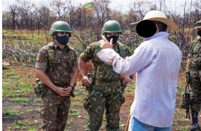
Figura 3- Tropa interagindo com população local

• Interações com a população local: A interação com a população local possibilita que o militar obtenha informação de valor imediato através de uma simples conversação a qual é balizada pelas regras de engajamento padronizadas pelo escalão superior com a interação direcionada em prol das necessidades de Inteligência, porém, sem revelar o real motivo e objetivo da conversação.