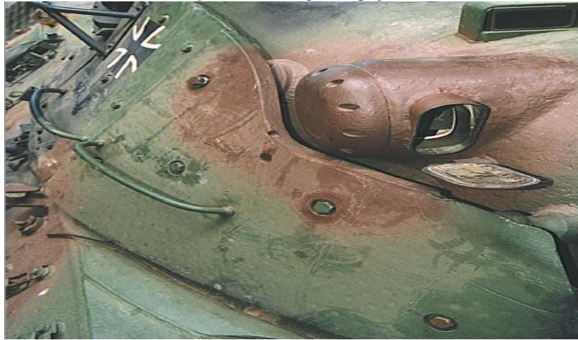
Figura 2: Blindagem Espaçada