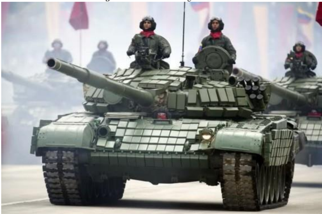
Figura 3: T-72 Com Blindagem Reativa