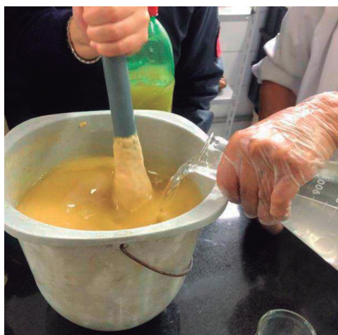
Fig. 1: Produção do Sabão

Após vários testes experimentais no laboratório de Ciências, as quantidades necessárias para a fabricação do produto foram: 3600 ml de óleo usado + 1800 ml de NaOH diluído em água + suco de 10 limões => 12 recipientes de 500 gramas de sabão.