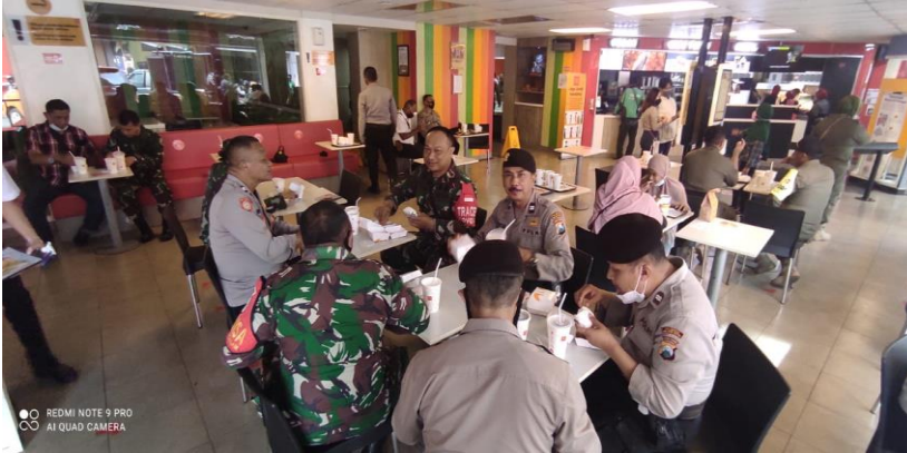
Figura 2 - Comandante Territorial da Região de Malang