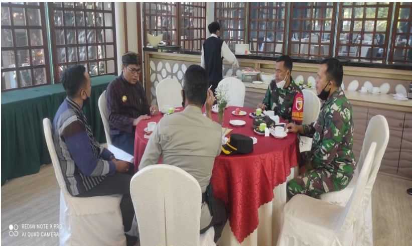
Figura 3 - Atividades comunitárias formais Estado Maior De Operação Territorial da Região de Palopo

A região de Palopo é uma parte oriental da Indonésia. Em contraste com a região de Malang onde as pessoas são mais relaxadas, na região de Palopo o povo é chamado de tribo Makasar, onde as pessoas são mais duras e sérias, de modo que na realização de atividades territoriais deve ser mostrado que se está sempre entre eles, para que haja aceitação.