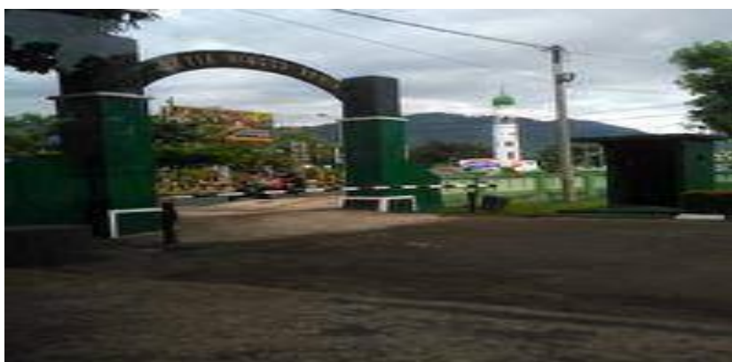
Figura 4 - Unidade Regional do Palopo

Para que os menos aptos possam aprender diretamente na prática, é necessário ganhar experiência e quem já tem habilidade pode ensinar quem tem falta. Aqui os problemas que surgem podem ser pelo menos muito resolvidos, e para a cultura das próprias pessoas que gostam de se reunir, a Unidade Territorial do Palopo também deve ser capaz de se adaptar à cultura da comunidade participando dessas atividades para que seus a existência permanece no campo e em determinados momentos realizar um evento conjunto com a comunidade, autoridades regionais e a comunidade para ficarem mais próximos da comunidade.