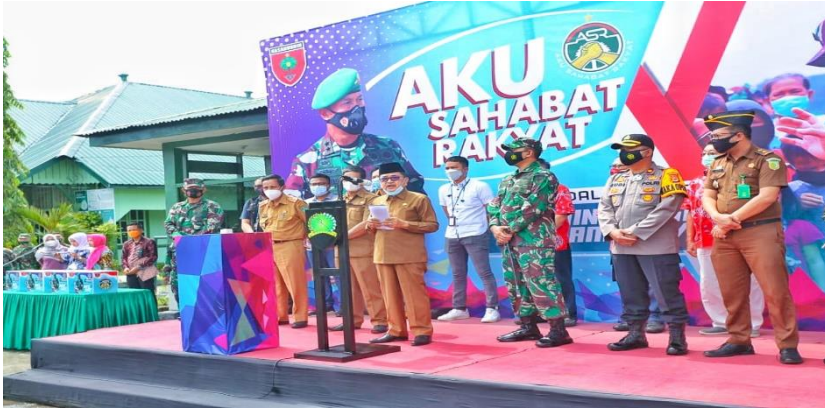
Figura 5 - Comandante Territorial da Região do Palopo

ajudar a cobrir toda a área de Palopo. Isso também ajudará as unidades de combate na área a se tornarem conhecidas do público, que provavelmente terá um efeito positivo nas unidades em Palopo, em particular e nos militares em toda a Indonésia.