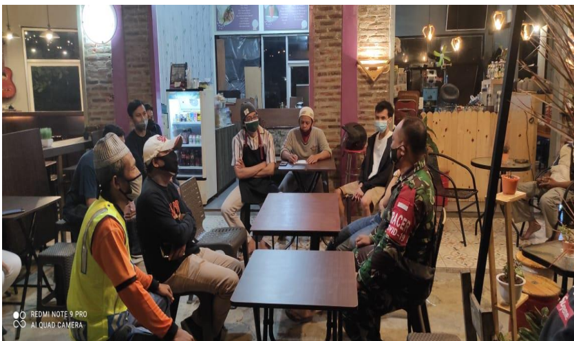
Figura 6 - Atividades comunitárias não formais