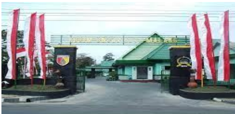
Figura 1 - Unidade Regional de Malang

Nesse sentido, o Comandante Regional de Malang tem uma solução para que o moral de seus membros seja mantido e possam realizar suas tarefas principais da melhor maneira possível, uma das quais é proporcionar bem-estar, como feriados, prêmios por conquistas e muitas outras coisas para aumentar o moral de os membros. Isso certamente tornará cada trabalho mais eficaz e eficiente. Assim, todos os problemas internos que existem dentro da unidade podem ser resolvidos paulatinamente.