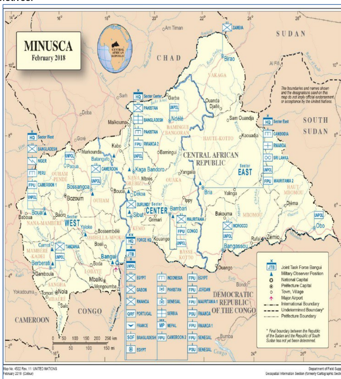
Figura 01 – Situação das tropas da MINUSCA em Fevereiro de 2018

Conforme o sítio eletrônico da MINUSCA, a Multidimensional Integrated Stabilization Mission in The Central African Republic (Missão Integrada Multidimensional das Nações Unidas para a Estabilização da República Centro-Africana) é uma missão da ONU com as missões prioritárias de proteger civis, dar apoio ao processo de pacificação, incluindo reconciliação nacional, coesão social e transição justa, facilitar a criação de um ambiente seguro para a assistência humanitária, proteção das Nações Unidas, e apoio para a extensão da autoridade do Estado Centro-Africano, desenvolvimento das forças de segurança e manutenção da integridade territorial. Podemos verificar na figura 1 as origens de suas tropas e efetivos.