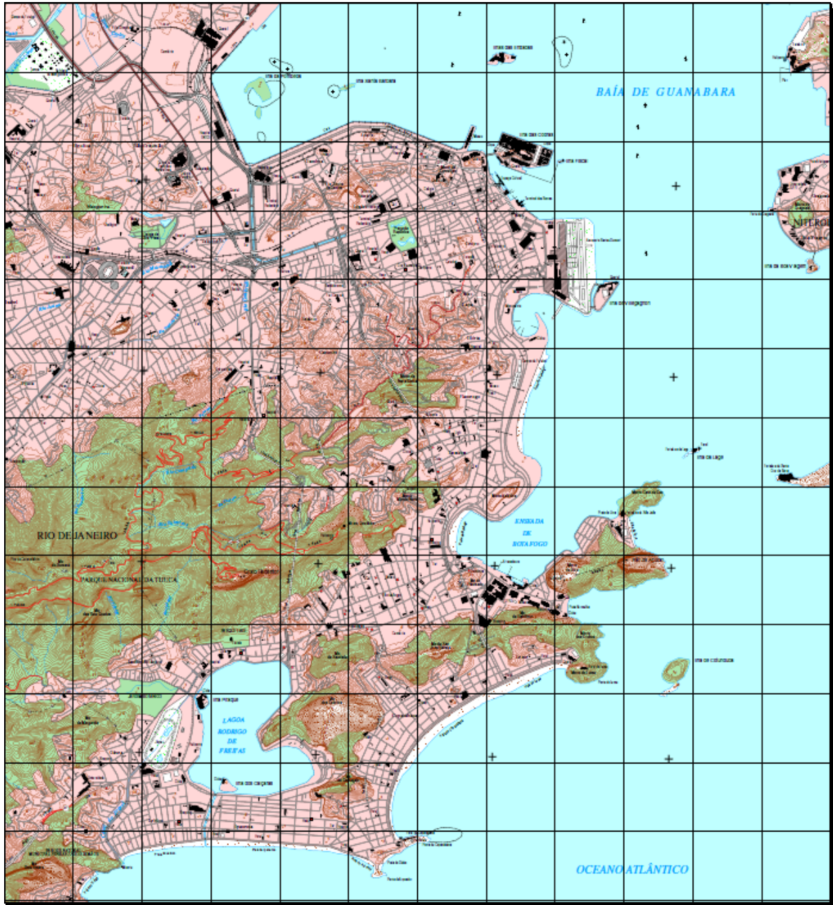
Figura 2: Carta Topográfica do Rio de Janeiro em escala 1:25.000.