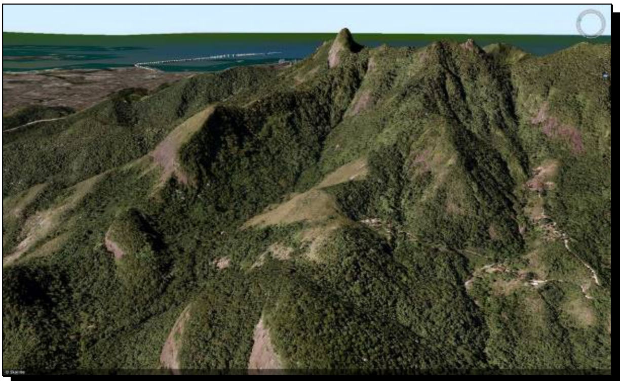
Figura 4: SIG 3D da região do Parque Nacional da Tijuca.