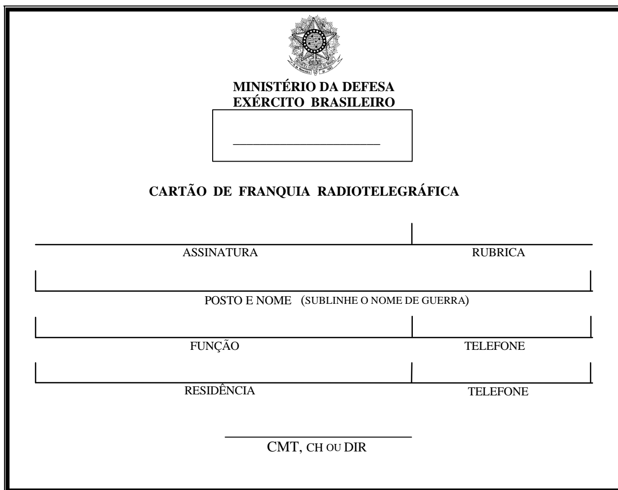
Fig Nr 2 - Modelo de cartão de franquia radiotelegráfica

Parágrafo único. O cartão deve ser preenchido em letra de forma, exceto os campos assinatura e rubrica.