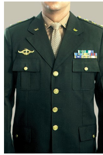
Fig 204 - Barretas

a) a disposição das barretas, usadas no peito, obedece ao prescrito nas letras a) e b) do inciso II anterior, de modo idêntico às condecorações que representam.