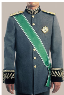
Fig 200 - Faixas