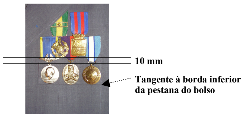
Fig 203 - A - Medalhas em mais de uma fileira

e) deverá ser evitada a existência de uma única medalha, isolada, acima da fileira composta por quatro medalhas;