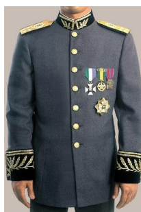
Fig 202 - Placas

a) as condecorações de méritos, constituídas por comendas, faixas ou placas, em consonância com o prescrito no art. 9º, § 1º e § 2º, do Decreto nº 40.556, de 1956, são dispostas da seguinte maneira: