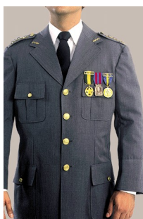
Fig 203 - Medalhas