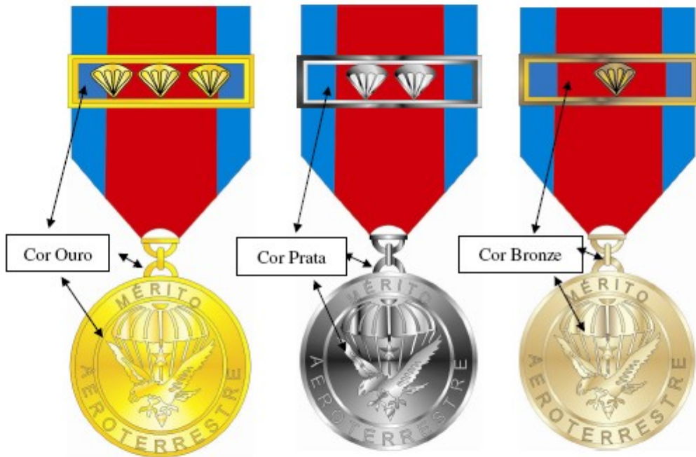
Medalha com passador de ouro