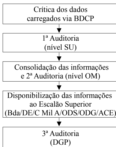
Figura 1 - Visão sistêmica

O Mapa da Força baseia-se na disponibilização dos dados de efetivo constantes da Base de Dados Corporativa de Pessoal (BDCP) do DGP, que são auditados em primeira instância pelas organizações militares da Força, a partir do nível subunidade. Após trabalhadas e homologadas, as informações de efetivo estarão disponíveis para consulta pelo escalão superior, em tempo real e com fidedignidade (Figura 1). Vencida essa etapa inicial, o Mapa da Força passa a ser controlado diariamente pelas organizações militares com a finalidade de mantê-lo sempre atualizado, retratando a real situação do Estado Efetivo.